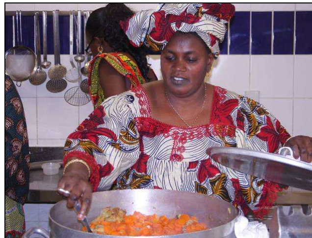
Atelier cuisine CFA Lycée Charles Privat