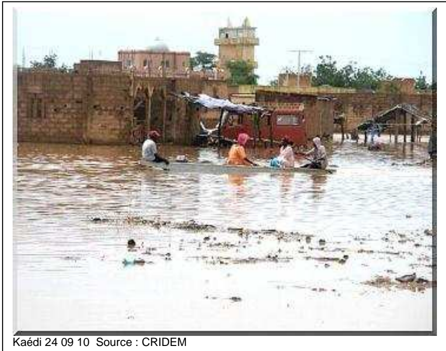
Kaédi 24 09 10