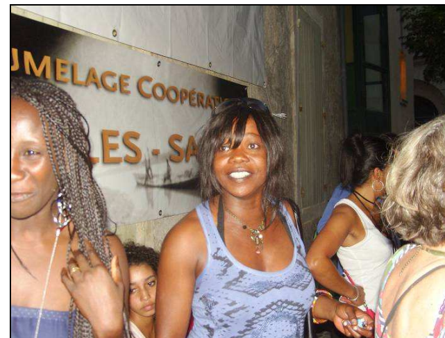
La Nuit de la Roquette