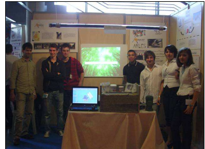
Fours solaires Lycée Louis Pasquet

Lettre aux Adhérents et Sympathisants - Octobre 2010 - N° 24