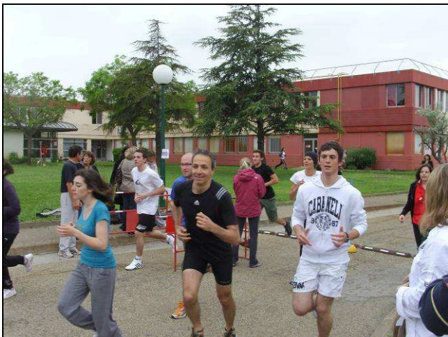
« 1 000 km pour Sagné » Lycées Montmajour – Perdiguier

« Le pessimisme de l'intelligence n'interdit pas l'optimisme de la volonté » ALAIN