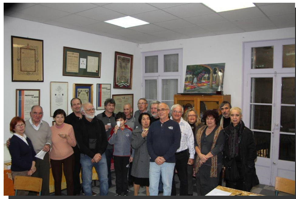
Fin de soirée

Assemblée Générale ordinaire du 17 janvier 2014