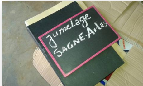
Des ardoises pour les plus petits...