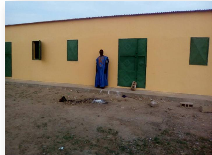
Toutes belles, toutes propres, les nouvelles classes du collège peintes.