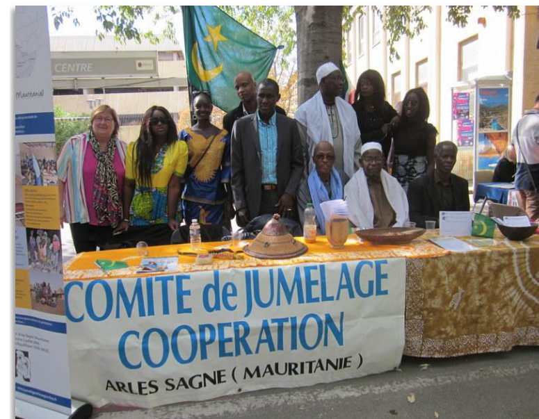
Une dizaine de Sagnankais à la Journée des Associations

Lettre aux Adhérents et Sympathisants n° 40 http://www.clubdesjumelages.com