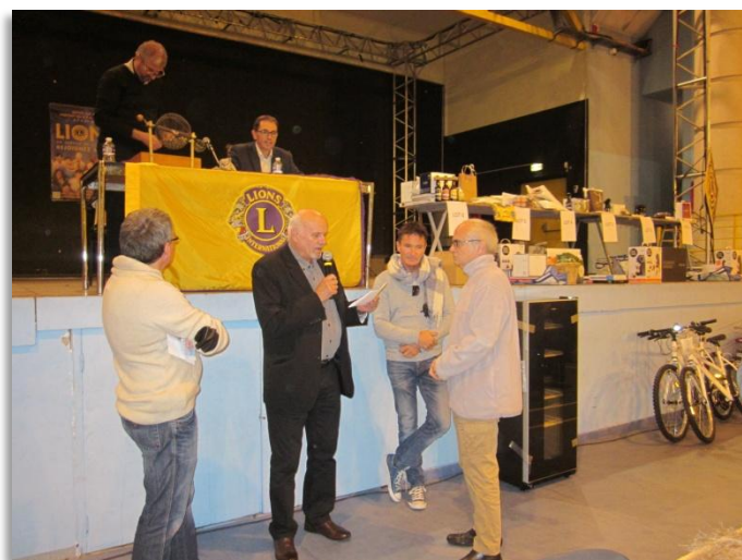
La contribution du Lions Club à l'envoi des camions de la SEA