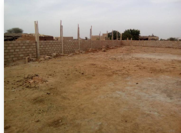
De la fabrication des briques à la construction du mur, 375 m de clôture.