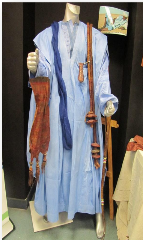
Exposition « Vêtements et parures en Mauritanie »

« Trois s'aidant l'un l'autre suffisent pour porter la charge de six ». Proverbe transmis par les Ressortissants Sagnankais