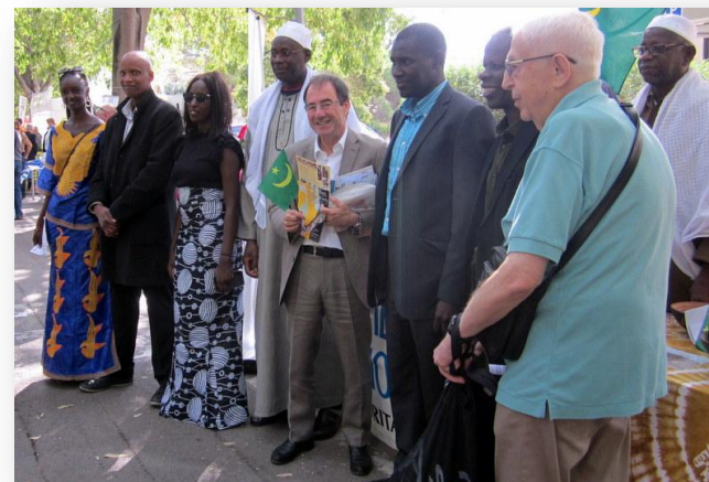
Réunion de travail entre Ressortissants de Marseille et du Nord et l'équipe d'Arles-Sagné