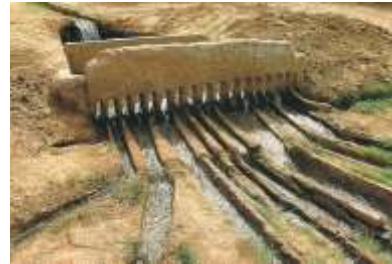
Peigne répartiteur de l'eau de la foggara

Une problématique passionnante à un moment où le développement du monde vivant a des exigences aussi bien quantitatives que qualitatives à l'égard de l'eau.