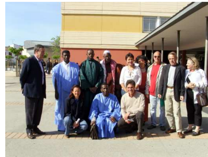
Lycées Perdiguier-Montmajour : M.Le Proviseur, les professeurs, les Ressortissants de Sagné et le comité