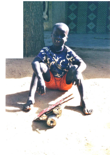
L'enfant à la charrette