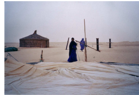
Femmes du Banc d'Arguin