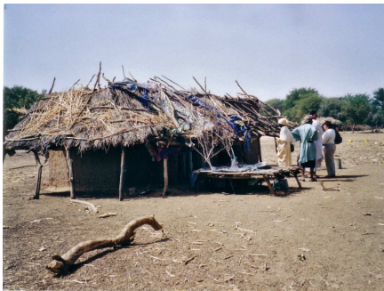
A Niaroual, quête d'ombre

BIENVENUE A TOUS NOS AMIS ! BISSIMILAMONE SEYLAABE 'AMENE FOF !