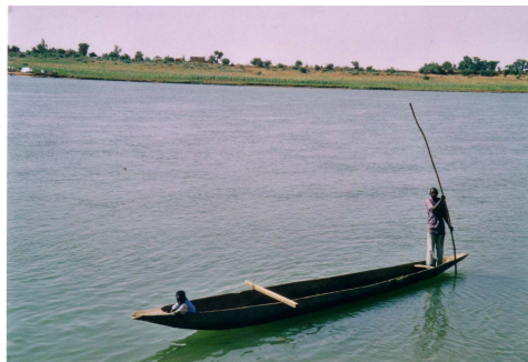
Sagné-Lobali, d'une rive à l'autre, la pirogue